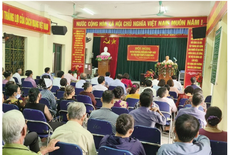
Tuyên truyền, phổ biến pháp luật và Trợ giúp pháp lý tại các xã, thị trấn

Với mục đích nâng cao nhận thức của các cấp, các ngành, các tầng lớp nhân dân về công tác phổ biến giáo dục pháp luật (PBGDPL), hòa giải ở cơ sở, chuẩn tiếp cận pháp luật; Hội đồng phối hợp PBGDPL huyện vừa ban hành văn bản đề nghị các thành viên Hội đồng phối hợp