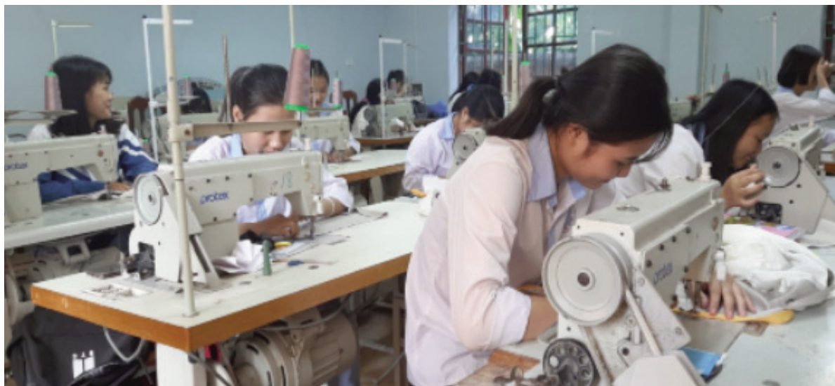
Đào tạo nghề may tại Trung tâm GGNN-GDTX huyện Yên Dũng

T rong những năm qua, công tác giáo dục nghề nghiệp (GDNN) nhằm nâng cao chất lượng nguồn nhân lực của các cấp ủy đảng, chính quyền địa phương, người lao động và người sử dụng lao động trên địa bàn huyện đã có nhiều thay đổi; các loại hình và hình thức dạy nghề phát triển đa dạng và phong phú, dạy nghề đã xuất phát từ nhu cầu thực tế của thị trường lao động và nhu cầu của người học nghề. Từ thực tiễn quá trình lãnh đạo, chỉ đạo và thực hiện công tác đào tạo, sử dụng nguồn nhân lực của huyện từ năm 2010 đến nay; UBND huyện rút ra một số bài học kinh nghiệm như sau: