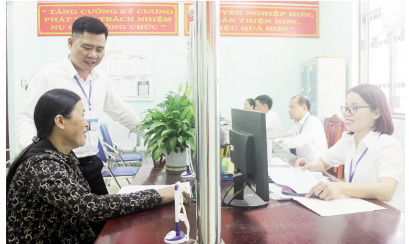
Người dân đến làm TTHC ở bộ phận "một cửa" xã Tân Liễu được tiếp đón, hướng dẫn tận tình.

UBND các xã, thị trấn thực hiện nghiêm túc việc công khai, minh bạch TTHC, quy trình giải quyết TTHC và các vấn đề có liên quan đến TTHC đối với các cá nhân và tổ chức đến làm việc tại trụ sở UBND; niêm yết TTHC trên môi trường mạng bằng quét mã QR code tại Bộ phận “Tiếp nhận và trả kết quả”, giúp người dân và tổ chức khi đến làm việc dễ dàng tra cứu TTHC mình quan tâm; duy trì thực hiện tốt hệ thống tin nhắn thông báo kết quả giải quyết TTHC cho tổ chức và công dân. Công khai đầy đủ số điện thoại của lãnh đạo Đảng ủy - HĐND - UBND và cán bộ, công chức tại bộ phận một cửa các xã, thị trấn. Lắp đặt 18/18 xã, thị trấn bộ phát Wifi miễn phí; đẩy mạnh thanh toán trực tuyến và thanh toán không dùng tiền mặt trong thực hiện thủ tục hành chính tại Bộ phận Một cửa các cấp. Thực hiện việc đổi mới cơ chế một cửa, một cửa liên thông trong giải quyết thủ tục hành chính và số hóa hồ sơ, kết quả giải quyết thủ tục hành chính trong tiếp nhận, giải quyết thủ tục hành chính theo đúng quy định tại Quyết định số 468/QĐ-TTg ngày 27/3/2021 và Nghị định số 107/2021/NĐ-CP ngày 06/12/2021. Hướng dẫn,