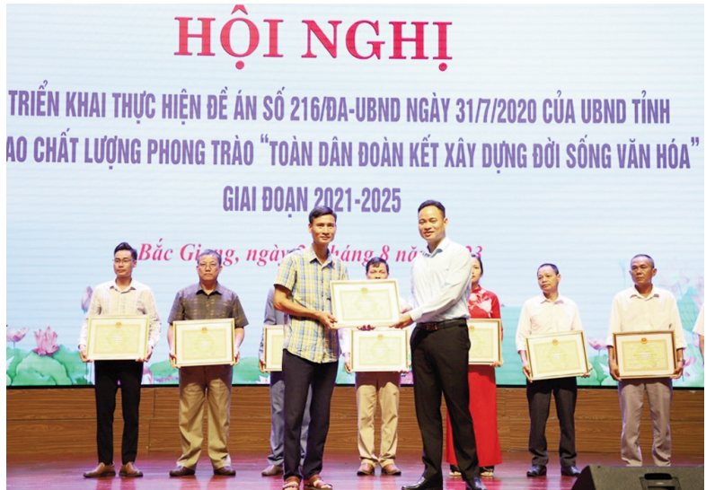
Tập thể thôn Đức Thành nhận Giấy khen vì có thành tích xuất sắc trong thực hiện Đề án số 216/ĐA-UBND

tế diễn ra sôi nổi. Thôn tích cực vận động Nhân dân chuyển dịch cơ cấu sản xuất nông nghiệp sang các mô hình sản xuất ứng dụng công nghệ cao cũng như trồng cây màu có giá trị kinh tế cao, từ đó năng suất và hiệu quả kinh tế được nâng lên rõ rệt. Trên địa bàn thôn có hợp tác xã Nông nghiệp công nghệ Cao Trí Yên, mô hình có liên kết sản xuất với tiêu thụ sản phẩm quy, mô hơn 2.800m 2 . Trồng dưa leo, dưa lưới, dưa Hàn Quốc, rau ăn lá, dâu tây... mỗi năm cho thu nhập hơn 1,5 tỷ đồng. Trong thôn có 14 hộ có mô hình sản xuất, chăn nuôi, làm xây dựng có thu nhập trên 100 triệu đồng/năm.