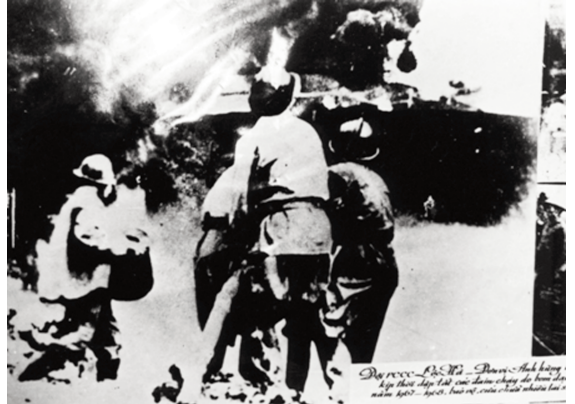
Ảnh tư liệu: Đội PCCC Lộc Hà dũng cảm cứu cháy kho xăng dầu Đức Giang

càng tiến bộ, để họ trở thành người giúp việc thật đắc lực cho các đồng chí.