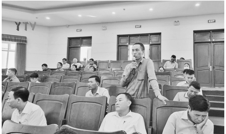
Trưởng thôn Yên Hồng, xã Yên Lư phát biểu ý kiến tại Hội nghị Thường trực Huyện ủy tiếp xúc, đối thoại với Bí thư Chi bộ, Trưởng thôn, Tổ trưởng Tổ dân phố trên địa bàn huyện

Trong thời gian qua, thực hiện Chỉ thị số 14-CT/TU, ngày 30/9/2021 của Ban Thường vụ Tỉnh ủy về việc nâng tỷ lệ đảng viên trong đội ngũ trưởng thôn, tổ dân phố; Ban Thường vụ Huyện ủy ban hành Kế hoạch thực hiện Chỉ thị; đồng thời, công tác tuyên truyền được các cấp ủy, tổ chức đảng quan tâm, thực hiện có hiệu quả. Việc lãnh đạo thực hiện Chỉ thị gắn với công tác bầu cử trưởng thôn, tổ trưởng tổ dân phố được thực hiện chặt chẽ bảo đảm nguyên tắc tập trung, dân chủ tạo được sự đồng thuận giữa ý Đảng với lòng dân nên tỷ lệ trưởng thôn, tổ dân phố là đảng viên được nâng lên rõ rệt.