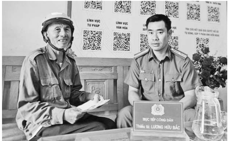
Công an xã Cảnh Thụy kịp thời ngăn chặn lừa đảo 285 triệu đồng trên không gian mạng

Có nhiều hình thức lừa đảo được thực hiện trên địa bàn huyện thời gian vừa qua, trong đó nổi lên là một số thủ đoạn sau: (1) Giả danh nhân viên nhà mạng, ngân hàng, điện lực... gọi điện cho bị hại với các nội dung liên quan đến tài khoản ngân hàng, sử dụng mạng viễn thông hay việc sử dụng điện... từ đó đối tượng chiếm đoạt tiền của nạn nhân; (2) Giả danh cán bộ Công an, Viện kiểm sát, Tòa án gọi điện thông báo người dân có liên quan đến vụ án rửa tiền, buôn bán ma túy do hành vi phạm tội mà có hoặc bị xử phạt nguội vi phạm giao