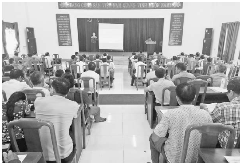
Ban Tuyên giáo Huyện uỷ phối hợp với Phòng Lao động – Thương binh và Xã hội huyện tổ chức Hội nghị tuyên truyền Chương trình mục tiêu Quốc gia giảm nghèo bền vững theo Quyết định số 238-QĐ/TW

Trước yêu cầu, nhiệm vụ chính trị của huyện nói chung, trong đó có nhiệm vụ phát triển kinh tế - xã hội là rất to lớn, nặng nề đòi hỏi