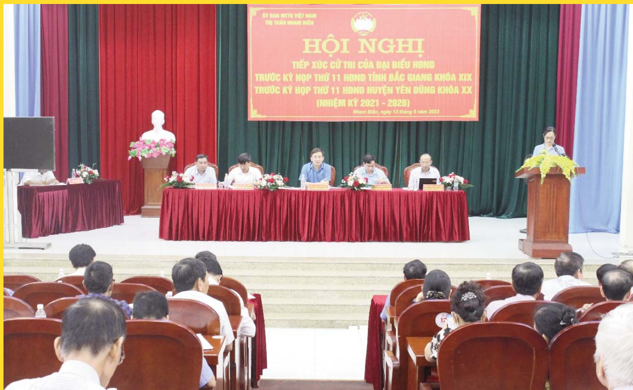
Hội nghị tiếp xúc cử tri trước kỳ họp của đại biểu HĐND tỉnh và HĐND huyện tại thị trấn Nham Biễn