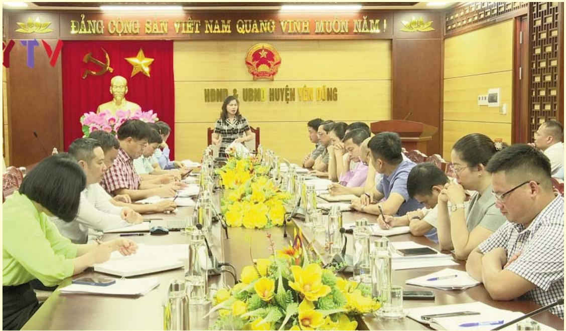
Thường trực HĐND tỉnh giám sát việc chấp hành pháp luật trong thực hiện dự án đầu tư xây dựng và kinh doanh cơ sở hạ tầng Khu công nghiệp Yên Lư