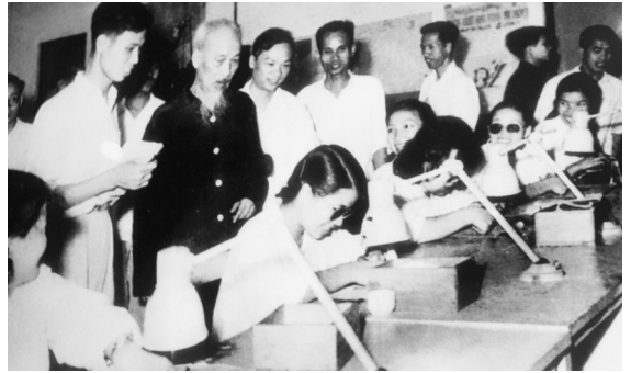
Chủ tịch Hồ Chí Minh thăm nhà máy Bóng đèn phích nước Rạng Đông, Hà Nội, ngày 28/4/1964.

Có thể khẳng định rằng, trong suốt quá trình hoạt động và lãnh đạo cách mạng sau này, Bác Hồ đặc biệt quan tâm tới từng bước đi, bước trưởng thành của Công đoàn Việt Nam. Người thường xuyên quan tâm đến công tác Công đoàn và phong trào công nhân lao động; dành nhiều thời gian để đi thăm, nói chuyện và chỉ dẫn về công tác Công đoàn. Trực tiếp Bác Hồ đã ký Sắc lệnh ban hành Luật Công đoàn, trong đó chỉ rõ mục đích của tổ chức công đoàn: “Công đoàn là phải cải thiện đời sống công nhân, nâng cao đời sống vật chất, văn hóa của giai cấp công nhân nói riêng và nhân dân nói chung”; đồng thời giao cho tổ chức công đoàn quyền quản lý, điều hành Quỹ bảo hiểm xã hội để duy trì hoạt động công đoàn và bảo đảm lợi ích thiết thực của người lao động.