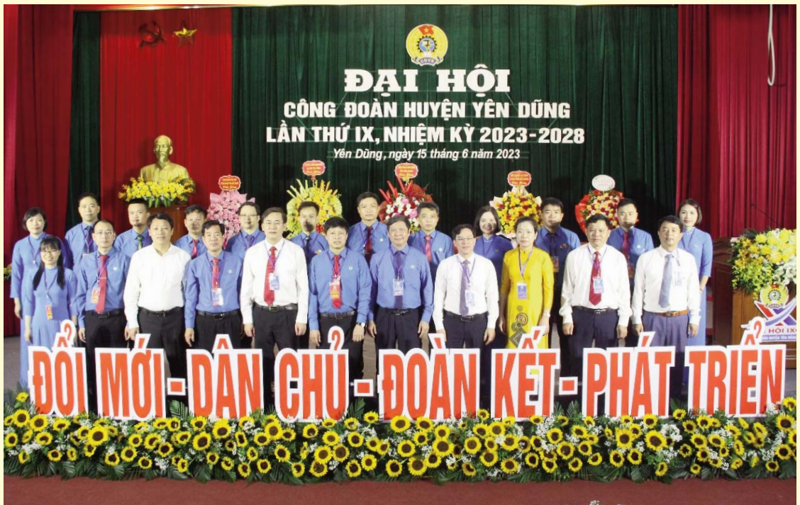
Các đồng chí lãnh đạo LĐLĐ tỉnh, huyện chụp ảnh lưu niệm với Ban Chấp hành Công đoàn huyện khóa IX, nhiệm kỳ 2023-2028