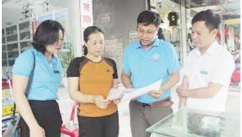
Cán bộ BHXH huyện tư vấn về BHXH tự nguyện cho người dân thị trấn Nham Biền

Công tác tuyên truyền, phổ biến chính sách pháp luật về BHXH tự nguyện trên địa bàn huyện luôn được tăng cường, đẩy mạnh đến các cơ quan, đơn vị, doanh nghiệp, người lao động và toàn thể Nhân dân trên địa bàn, phát huy vai trò của các hội, đoàn thể, nhất là trong “Tháng cao điểm” vận động người dân tham gia BHXH tự nguyện nhằm củng cố niềm tin, tạo sự đồng thuận trong quần chúng Nhân dân về chính sách an sinh xã hội của Đảng và Nhà nước. Ban Tuyên giáo Huyện ủy chủ trì, phối hợp với các cơ quan chức năng đẩy mạnh