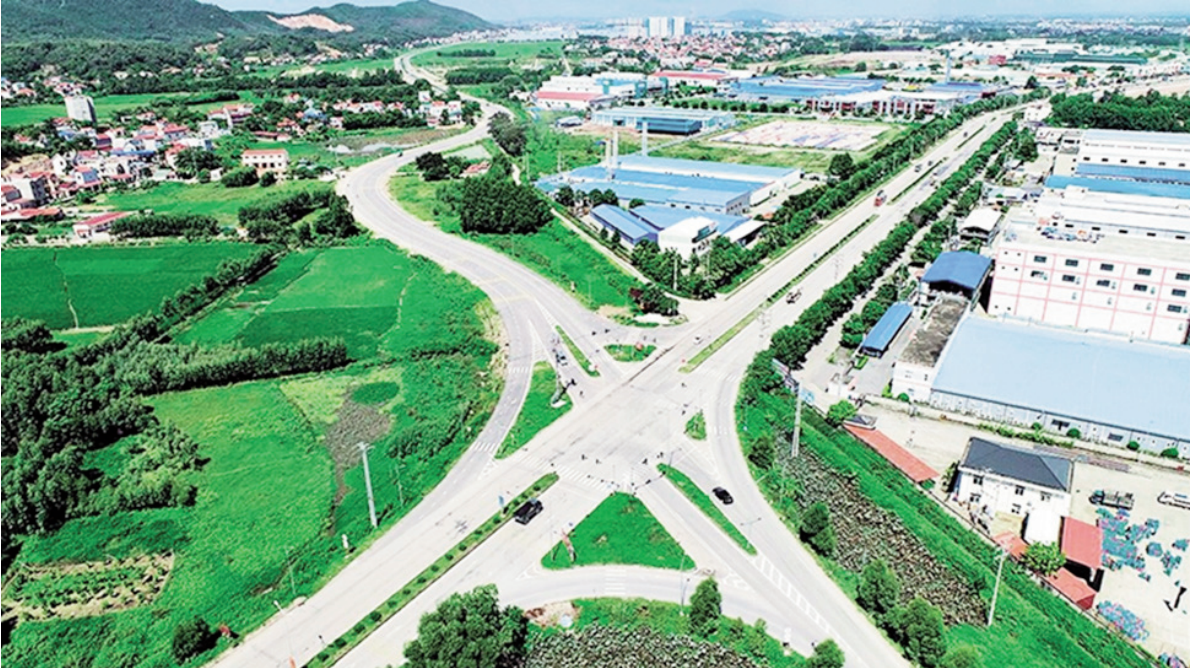
Đầu đường nối Quốc lộ 17 – Quốc lộ 37 thuộc địa phận xã Tiên Phong

Sau hơn 02 năm thực hiện Nghị quyết Đại hội Đảng các cấp, nhiệm kỳ 2020-2025, trong bối cảnh có nhiều khó khăn, thách thức, đặc biệt là ảnh hưởng của dịch bệnh Covid-19, song Đảng bộ, chính quyền và nhân dân trong huyện đã phát huy tốt truyền thống đoàn kết, có nhiều nỗ lực, sáng tạo và quyết tâm trong thực hiện nhiệm vụ, nên đã đạt được kết quả toàn diện trên các lĩnh vực. Tốc độ tăng trưởng giá trị sản xuất bình quân tăng khá, đạt