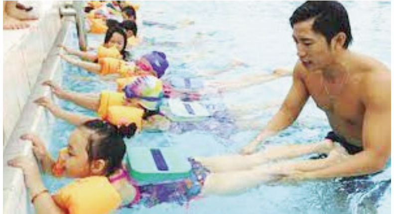
Tham gia các lớp học bơi sẽ hạn chế nguy cơ đuối nước ở trẻ em

Trong thời gian gần đây trên địa bàn tỉnh Bắc Giang nói chung và địa bàn huyện Yên Dũng nói riêng đã xảy ra một số vụ tai nạn thương tích, đuối nước đối với trẻ em. Nhằm quản lý, bảo đảm an toàn, tạo sân chơi lành mạnh cho trẻ em, thanh, thiếu niên,