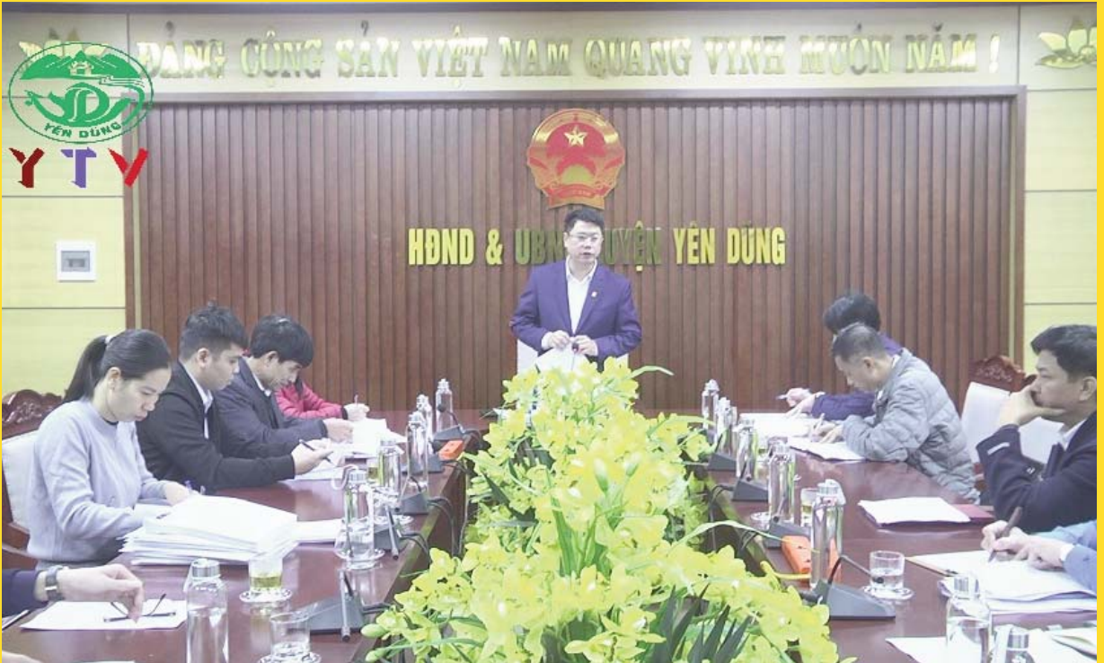
Ban Chỉ đạo Phong trào “Toàn dân đoàn kết xây dựng đời sống văn hóa” và công tác gia đình tỉnh kiểm tra kết quả thực hiện phong trào TĐĐKXĐĐSVH năm 2023 của huyện