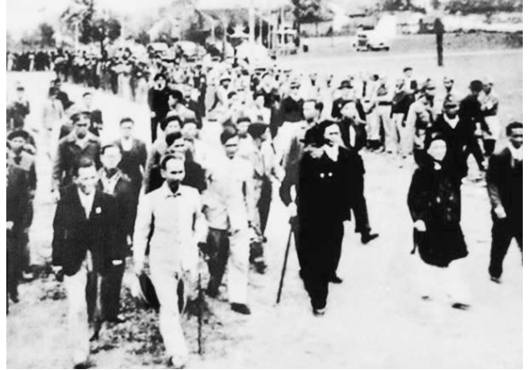
Ảnh tư liệu: Ngày 5/1/1946, hàng nghìn người Hà Nội đón mừng Chủ tịch Hồ Chí Minh và các vị được giới thiệu ứng cử đại biểu Quốc hội khóa I.

Để mở rộng khối đại đoàn kết toàn dân, thực hiện chủ trương “thống nhất, thống nhất và thống nhất”, Chủ tịch Hồ Chí Minh và Tổng bộ Việt Minh quyết định mời tất cả những người ngoài Mặt trận Việt Minh cùng đứng chung danh sách ứng cử. Hành động này chứng tỏ, Chính phủ và Việt Minh luôn tôn trọng quyền tự do dân chủ của nhân dân, tôn trọng người có tài, đoàn kết mọi lực lượng yêu nước, thiện tâm, thiện chí vì quyền lợi tối cao của dân tộc. Chủ tịch Hồ Chí Minh khẳng định: “Tổng tuyển cử là một dịp cho toàn thể quốc dân tự do lựa chọn những người có tài, có đức, để gánh vác công việc nước nhà. Trong cuộc Tổng tuyển cử, hễ là những người muốn lo việc nước thì đều có quyền ra ứng cử; hễ là công dân thì đều có quyền đi bầu cử. Không chia gái trai, giàu nghèo, tôn giáo, nòi giống, giai cấp, đảng phái, hễ là công dân Việt Nam