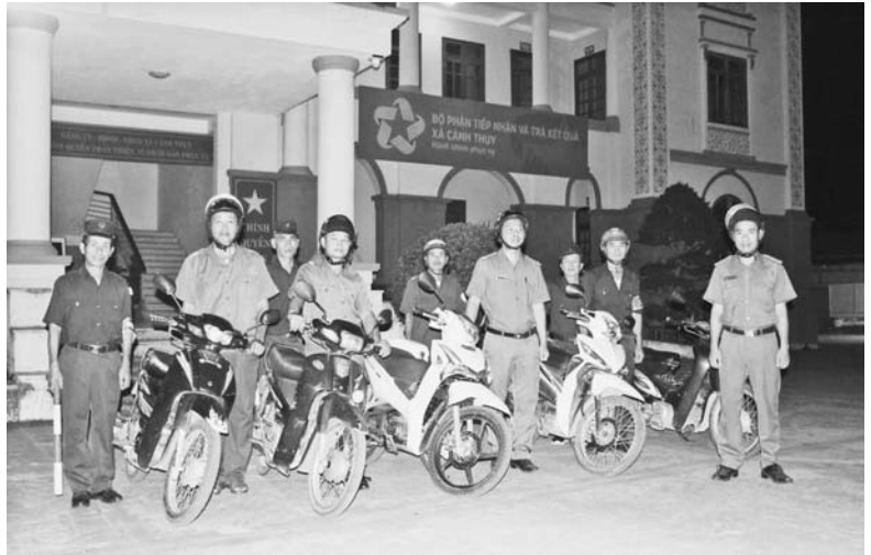
Công an xã Cảnh Thụy và Đội tự quản CCB làm nhiệm vụ đảm bảo an ninh trật tự trong kỳ nghỉ Lễ 2/9/2023

Theo thống kê của UBND huyện, hiện nay 18/18 xã, thị trấn trên địa bàn có 100% lực lượng Công an xã chính quy. Công an các xã, thị trấn thực hiện có hiệu quả các nhiệm vụ do cấp ủy, chính quyền địa phương giao, tham mưu cho cấp ủy, chính quyền địa phương thực hiện tốt công tác bảo đảm ANTT trên địa bàn. Tập trung tham mưu triển khai thực hiện tốt các mặt công tác quản lý nhà nước về an ninh trật tự như: cường công tác quản lý nhân hộ khẩu, quản lý, kiểm tra cư trú, quản lý người nước ngoài nhập cảnh, tạm trú, cư trú tại địa phương gắn với triển khai thực hiện có hiệu quả các