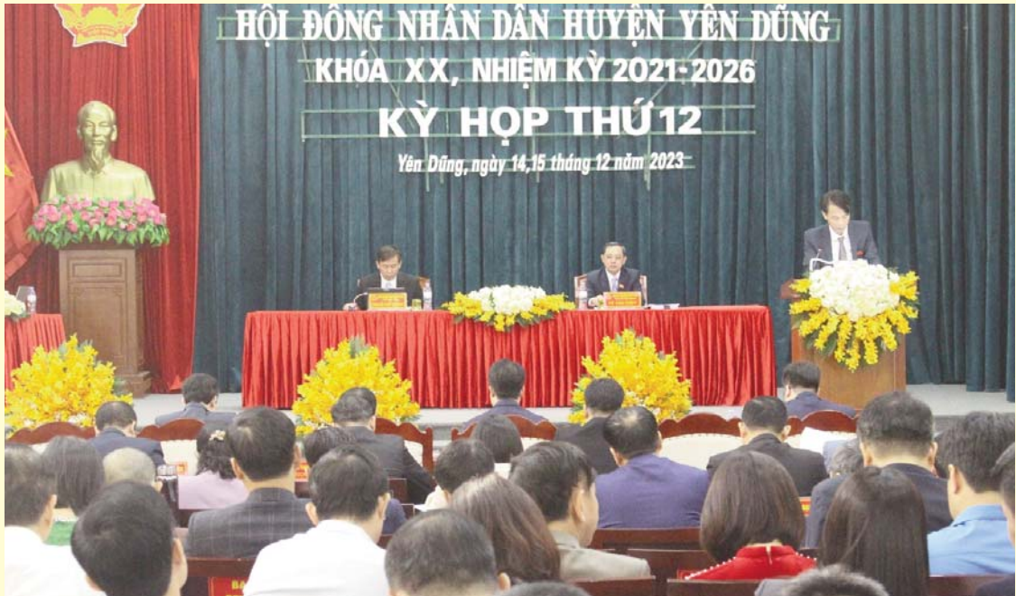
Quang cảnh Kỳ họp thứ 12, HĐND huyện khóa XX, nhiệm kỳ 2021-2026