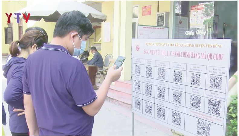
Người dân khai thác thủ tục hành chính qua ứng dụng quét mã QR Code

Ngành Công an đã triển khai thực hiện 05 lĩnh vực dịch vụ liên quan đến nghiệp vụ của lực lượng, trong đó: đăng ký, cấp biên số mô tô, xe gắn máy; thu tiền phạt nguội và xác nhận số Chứng minh nhân dân đều đạt tỷ lệ 100%; lĩnh vực đăng ký, quản lý cư trú đạt tỷ lệ gần 93%; Ngành Tư pháp đã tiếp nhận giải quyết 03 dịch vụ công theo chức năng gồm: đăng ký khai sinh; đăng ký khai tử và đăng ký kết hôn đều đạt tỷ lệ 100%. Lĩnh vực BHXH đạt tỷ lệ 100% trong cấp thẻ trẻ em liên thông dưới 6 tuổi. Lĩnh vực Thuế cũng đạt tỷ lệ 100% trong đăng ký thuế lần đầu, đăng ký thay đổi thông tin đăng ký thuế đối với người nộp thuế là hộ gia đình, cá nhân. Lĩnh vực Đất đai đạt 100% trong thực hiện đăng ký biến động về quyền sử dụng đất, quyền sở hữu tài sản gắn