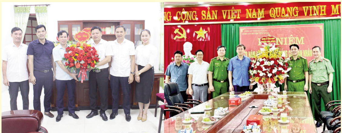
Các đ/c Thường trực Huyện ủy tặng hoa chúc mừng Ngày truyền thống ngành Tuyên giáo của Đảng (01/8) và Ngày truyền thống Công an Nhân dân Việt Nam (19/8)