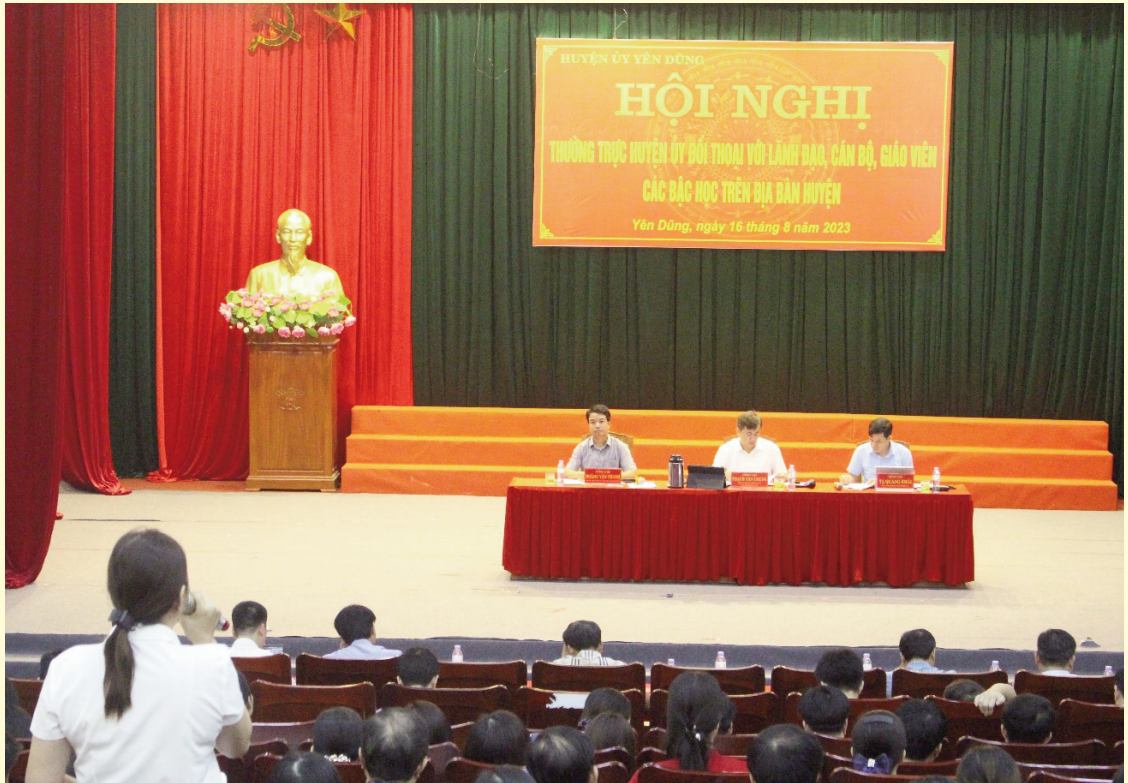
Các đồng chí Thường trực Huyện ủy đối thoại với cán bộ quản lý, giáo viên ngành Giáo dục - Đào tạo huyện