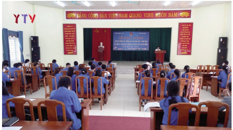
Lớp bồi dưỡng kết nạp Đảng

Thường xuyên chăm lo công tác giáo dục chính trị cho đội ngũ đảng viên: Các cấp ủy, tổ chức đảng đã thường xuyên quán triệt và đẩy mạnh công tác tuyên truyền, giáo dục đối với đội ngũ đảng viên, nhất là đảng viên trẻ; nhằm nâng cao nhận thức, khả năng tự chủ động đấu tranh phản bác những quan điểm sai trái, thù địch, tiếp thu có chọn lọc. Thường xuyên nắm