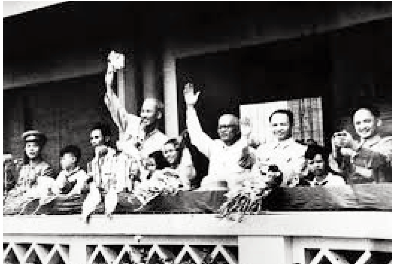
Ảnh tư liệu

Tiếp đến, Bác ký các Sắc lệnh thưởng huân chương, huy chương cho những đơn vị, cá nhân đã anh dũng