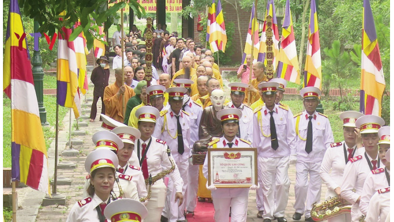
Đại lễ Phật đản Phật lịch 2567- dương lịch 2023 tại chùa Vinh Nghiêm

Hiện nay, Nhà nước đã công nhận 43 tổ chức thuộc 16 tôn giáo khác nhau, với khoảng 27 triệu tín đồ, trên 53 nghìn chức sắc, khoảng 135 nghìn chức việc, trên 29 nghìn cơ sở thờ tự... Hàng năm, có trên 8.000 lễ hội về tín ngưỡng, tôn giáo với hàng vạn tín đồ tham gia và trong 10 năm thực hiện chính sách, pháp luật về tín ngưỡng, tôn giáo, cơ quan nhà nước có thẩm quyền đã cấp hàng trăm hecta đất để xây dựng cơ sở thờ tự... Điều đó thể hiện Đảng, Nhà nước luôn nhất quán chính sách tôn trọng và đảm bảo quyền tự do tín ngưỡng, tôn giáo của công dân. Thực tế đã chứng minh, các tổ chức tôn giáo được tạo thuận lợi trong hoạt động và ngày càng phát triển về mọi mặt; đồng bào các tôn giáo ngày càng tin tưởng vào sự lãnh đạo của Đảng, sự quản lý của Nhà nước, nghiêm chỉnh chấp hành pháp luật, tích cực tham gia phát triển kinh