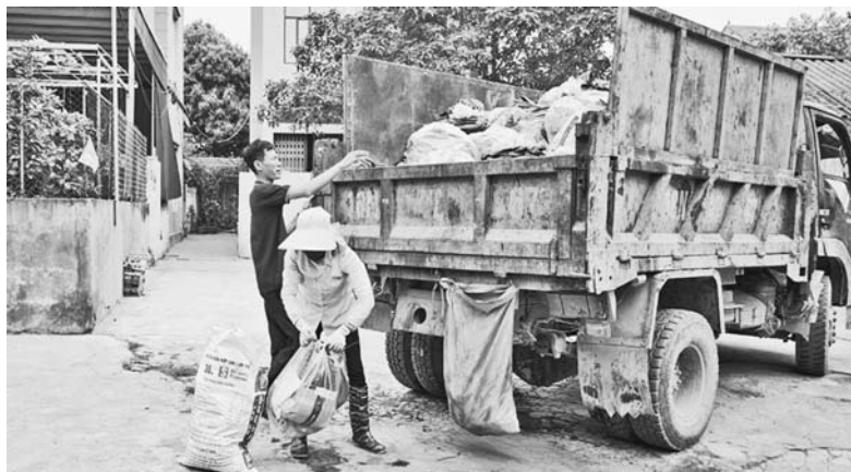
Thu gom rác tại thôn Dũng Tiến, xã Hương Gián

Tiếp tục thực hiện sự chỉ đạo của Tỉnh ủy tại Kết luận 99-KL/TU ngày 18/5/2021 của BTV Tỉnh ủy và Kế hoạch số 278/KHUBND ngày 18/6/2021 của UBND tỉnh, trong quý III/2023, Huyện ủy, UBND huyện đã tích cực chỉ đạo các cơ quan tuyên truyền huyện duy trì việc xây dựng chuyên trang, chuyên mục, phóng sự tuyên truyền, ghi hình, đưa tin về các hoạt động thu gom, xử lý rác thải, chôn lấp và bảo vệ