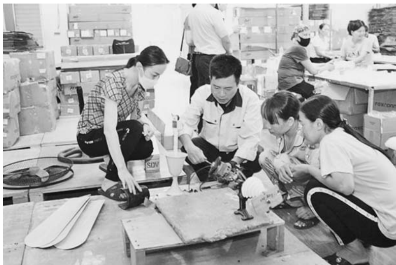
Học viên lớp học nghề Điện dân dụng

Với mục đích quán triệt sâu sắc, triển khai thực hiện nghiêm, thiết thực, hiệu quả Chỉ thị số 21-CT/TW, Kế hoạch số 89-KH/TU và Kế hoạch số 41/KH-UBND, các quan điểm, chủ trương của Đảng, chính sách, pháp luật của Nhà nước về đổi mới, phát triển và nâng cao chất lượng giáo dục nghề nghiệp (GDNN) nhằm nâng cao nhận thức và trách nhiệm của cấp ủy, chính quyền, Mặt trận Tổ quốc, các tổ chức chính trị - xã hội, cán bộ, đảng viên, các tầng lớp Nhân dân, doanh nghiệp về vị trí, vai trò, tầm quan trọng của GDNN trong phát triển kinh tế - xã hội, góp phần tạo việc làm bền vững cho người lao động, nâng cao chất lượng nguồn nhân lực trên địa bàn huyện... UBND huyện vừa ban hành Kế hoạch triển khai thực hiện Kế hoạch số 89-KH/TU ngày 14/6/2023 của Ban Thường vụ Tỉnh ủy quán triệt, triển khai thực hiện Chỉ thị số 21-CT/TW ngày 04/5/2023 của Ban Bí thư về tiếp tục đổi mới, phát triển và nâng cao chất lượng giáo dục nghề nghiệp đến năm 2030, tầm nhìn đến năm 2045