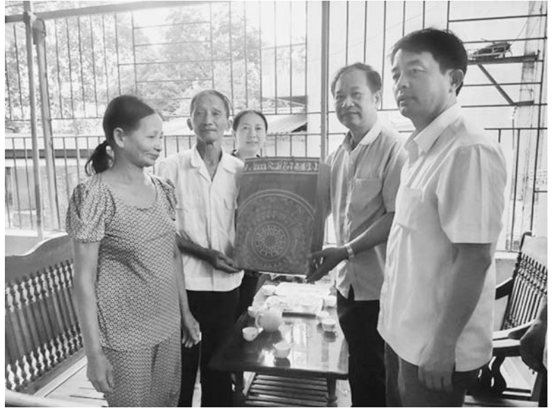
Lãnh đạo MTTQ tỉnh, huyện thăm và tặng quà người có công tiêu biểu trên địa bàn huyện

Ủy ban MTTQ huyện luôn chủ động, tích cực đổi mới nội dung, phương thức hoạt động theo phương châm hướng về cơ sở, tăng cường rà soát nhu cầu, nắm bắt tâm tư, nguyện vọng của đoàn viên, hội viên và các tầng lớp Nhân dân; thực hiện tốt quy chế dân chủ ở cơ sở, tích cực tham gia xây dựng đảng, chính quyền, giám sát các hoạt động của cơ quan quản