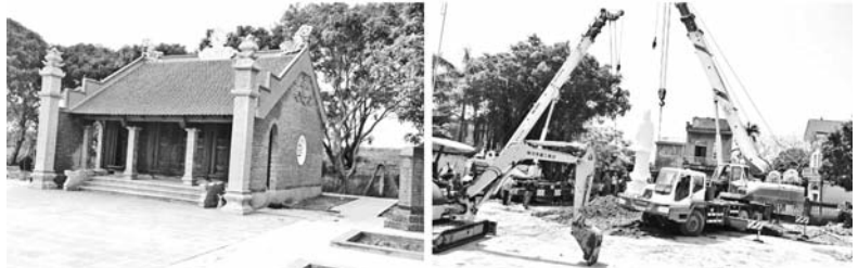
Tổ Dân vận cộng đồng thôn Chùa, xã Tiến Dũng tham gia giám sát công trình xây dựng trên địa bàn thôn

thể và người có uy tín trong thôn). Tổ Dân vận cộng đồng thôn Chùa đã thành lập 07 nhóm Dân vận cộng đồng, được phân công phụ trách tới các hộ gia đình trong thôn. Các thành viên đều là những người tiêu biểu, có năng lực, nhiệt tình, trách nhiệm, có khả năng tuyên truyền, vận động, thuyết phục, am hiểu pháp luật, có uy tín, có tinh thần, trách nhiệm vì cộng đồng, sử dụng được điện thoại thông minh. Chỉ đạo các nhóm lập danh sách thành viên từng gia đình, thành lập nhóm zalo gồm đại diện thành viên các hộ để trao đổi thông tin hai chiều. Ở mỗi tổ