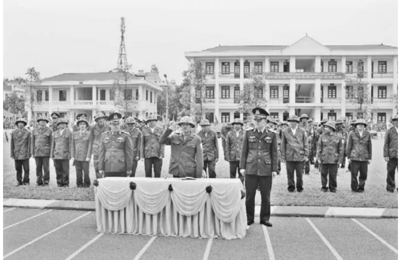
Lễ ra quân huấn luyện năm 2023

Với mưu đồ đen tối, các thể lực thù địch ra sức chống phá, xuyên tạc, hòng “phi chính trị hóa”, “dân sự hóa” Quân đội. Chúng coi đây là một trong ba trọng tâm chống Đảng, Nhà nước và hướng lái, chuyển hóa cách mạng Việt Nam. Kế hoạch của chúng là: lấy phá vỡ nền tảng chính trị là then chốt; chống phá về kinh tế là biện pháp cơ bản, thường xuyên, lâu dài; “phi chính trị hóa” lực lượng vũ trang là nhiệm vụ trọng yếu. Thủ đoạn đó không mới, nhưng cực kỳ nguy hiểm, nhằm xóa nhòa bản chất giai