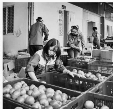
Sản xuất và sơ chế nông sản tại HTX Rau sạch Yên Dũng

đầu để tạo sự thống nhất cao trong nhận thức ở tất cả các cấp, các ngành. Đồng thời thực hiện tuyên truyền, phổ biến thông tin về Nghị quyết số 20-NQ/TW, Chương trình số 38-Ctr/TU, Kế hoạch số 641/KH-UBND tại các xã, thị trấn với quy mô sâu rộng, nhiều hình thức đa dạng, phong phú, nội dung thiết thực nhằm nâng cao nhận thức của cán bộ, đảng viên và quần chúng nhân dân về bản chất, vai trò của kinh tế tập