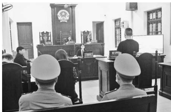
Toà án Nhân dân huyện xét xử vụ án “Cướp tài sản”

Kết quả, Toà an huyện đã giải quyết xong 715 vụ việc, còn đang giải quyết 12 vụ việc, tỉ lệ giải quyết đạt 98,3%. Trong đó: đưa ra xét xử 260 vụ, việc; trả hồ sơ để điều tra bổ sung: 11 vụ; đình chỉ giải quyết 165 vụ, việc; hòa giải thành theo luật tố tụng 179 vụ; hoà giải thành theo Luật Hoà giải và đối thoại tại Toà án: 100 vụ. Các vụ án đều được giải quyết, xét xử trong thời hạn luật định, việc xét xử đảm bảo đúng người, đúng tội, đúng pháp luật,