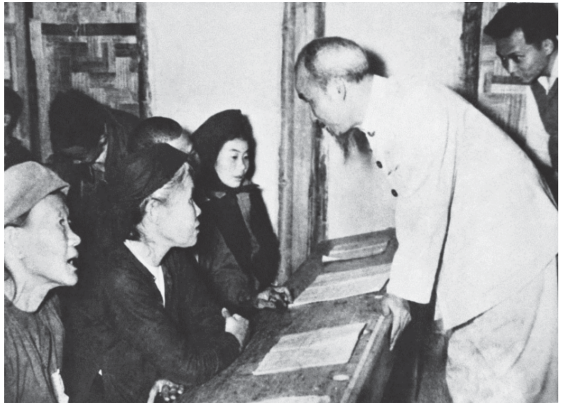
Chủ tịch Hồ Chí Minh thăm lớp bồi dưỡng văn hóa của bà con lao động ở khu Lương Yên, thành phố Hà Nội (ngày 27/3/1956)

Một là , thực hiện quyền con người trên nền tảng độc lập dân tộc, chủ quyền quốc gia. Trong những năm bốn ba tìm đường cứu nước, Chủ tịch Hồ Chí Minh đã rút ra một chân lý phổ biến là: Độc lập cho dân tộc là điều vô cùng quý giá, là tiền đề tiên quyết để giải phóng con người, bảo đảm quyền con người. Người cho rằng, giành được độc lập dân tộc rồi thì phải xây dựng