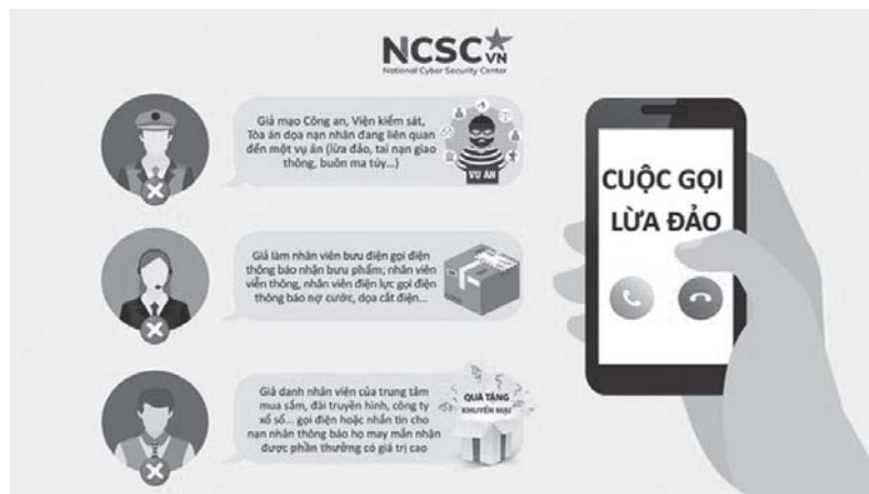
Một số kịch bản lừa đảo trên không gian mạng phổ biến hiện nay

Nguyên nhân chủ yếu xuất phát từ sự thiếu hiểu biết về pháp luật, nhẹ dạ cả tin, lòng tham, sợ hãi... đã khiến không ít người dân trở thành nạn nhân của tội phạm lừa đảo chiếm đoạt tài sản trên không gian mạng. Dự báo thời gian tới, tội phạm này sẽ tiếp tục diễn biến phức tạp, gia tăng về số vụ, thủ đoạn, quy mô, tính chất ảnh hưởng xấu đến tình hình an ninh trật tự.