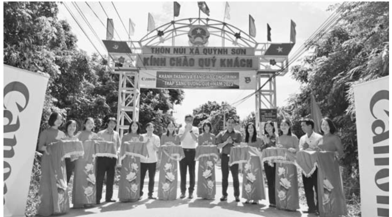
Các đại biểu cắt băng khánh thành Công trình “Tháp sáng vùng quê” tại xã Quỳnh Sơn

Từ thực tiễn trong việc thực hiện chuyển đổi số trong thời gian qua trên địa bàn huyện rút ra một số bài học kinh nghiệm như sau: