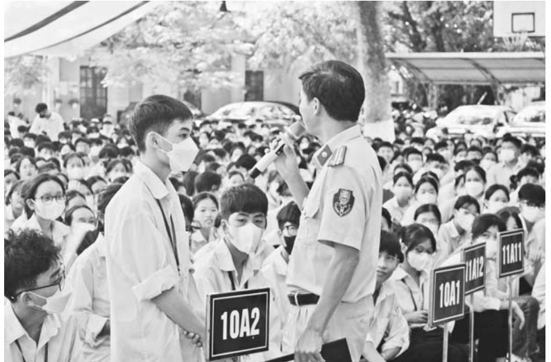
Cán bộ Công an huyện tuyên truyền Luật An toàn giao thông tại Trường THPT Yên Dũng số 2

Nội dung hướng dẫn cách thức ghi nhận, cung cấp thông tin: (1) Hướng dẫn Nhân dân phương pháp ghi nhận các thông tin, hình ảnh phản ánh hành vi vi phạm: