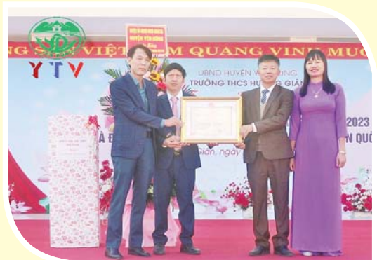
Các đ/c lãnh đạo tỉnh, huyện chúc mừng ngày Nhà giáo Việt Nam 20/11 một số nhà trường trên địa bàn huyện