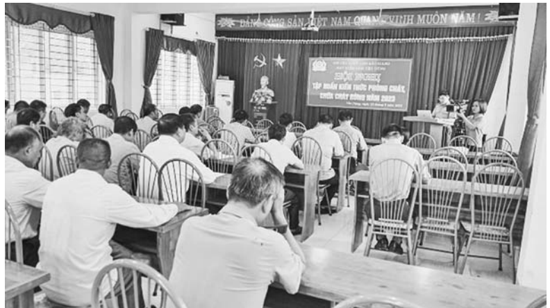
Tập huấn kiến thức phòng cháy, chữa cháy rừng năm 2023

Một là , công tác PCCC và CNCH chỉ có thể đạt hiệu quả cao khi phát huy được sức mạnh tổng hợp của cả hệ thống chính trị, có sự quan tâm chỉ đạo quyết liệt của cấp ủy, chính quyền các cấp; phát huy được vai trò tham mưu, hướng dẫn và vai trò nòng cốt của lực lượng Công an và sự tham gia tự giác, tích cực của các cơ quan, đoàn thể, đơn vị cơ sở, hộ gia đình và mọi tầng lớp nhân dân.