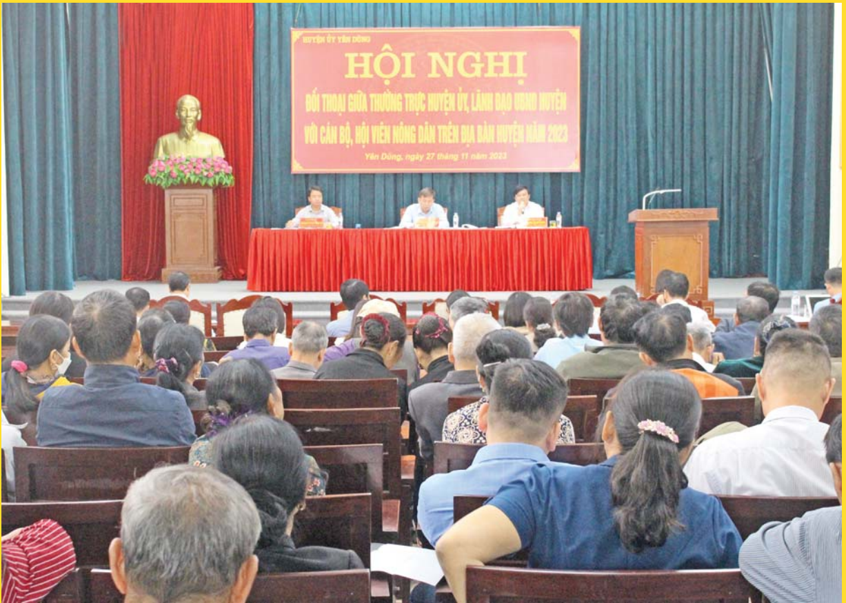
Hội nghị đối thoại giữa Thường trực Huyện uỷ, lãnh đạo UBND huyện với cán bộ, hội viên nông dân trên địa bàn huyện năm 2023