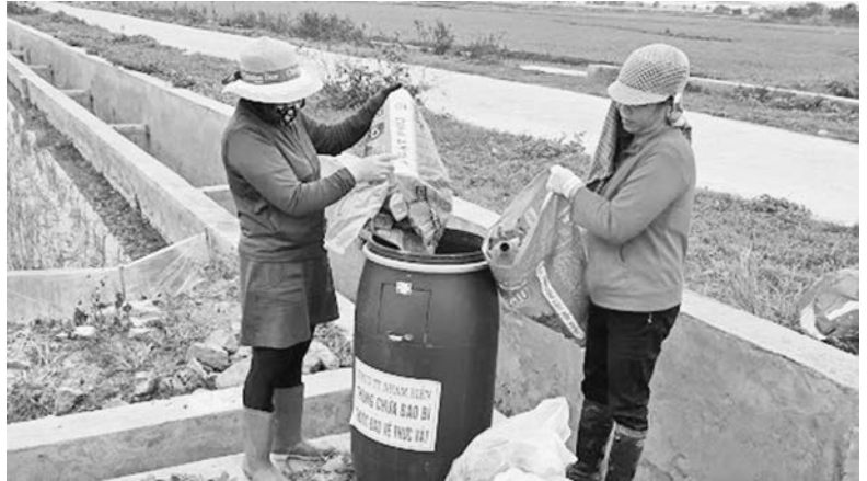
Nhiều rác, bao bì thuốc bảo vệ thực vật được các nông dân thu gom, tập kết

Xác định công tác bảo vệ môi trường là nhiệm vụ quan trọng trong phát triển kinh tế - xã hội, bảo vệ sức khỏe Nhân dân; để công tác thu gom rác, xử lý rác thải đạt hiệu quả, trong thời gian qua, UBND huyện tiếp tục