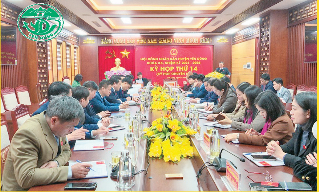
Kỳ họp thứ 14 (kỳ họp chuyên đề) HĐND huyện khóa XX, nhiệm kỳ 2021 - 2026