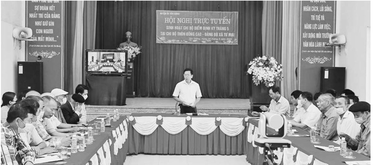
Ảnh tư liệu: Buổi sinh hoạt chi bộ điểm ở Chi bộ thôn Đồng Cao, xã Tư Mại (Yên Dũng).

T rên cơ sở những tồn tại, hạn chế đã được chỉ ra qua kiểm điểm cuối năm 2023, nhằm khắc phục những mặt hạn chế, yếu kém của tổ chức cơ sở Đảng (TCCSĐ) gắn với tiếp tục thực hiện Nghị quyết Trung ương 4 (Khóa XI, Khóa XII), góp phần nâng cao năng lực lãnh đạo, sức chiến đấu của các TCCSĐ, tạo sự chuyển biến rõ rệt về chất lượng của các loại hình TCCSĐ, làm cho tổ chức đảng ở cơ sở vững mạnh về chính trị, tư tưởng và tổ chức, lãnh đạo thực hiện tốt nhiệm vụ chính trị và kịp thời giải quyết những vấn đề phức tạp xảy ra ở cơ sở; Ban Thường vụ