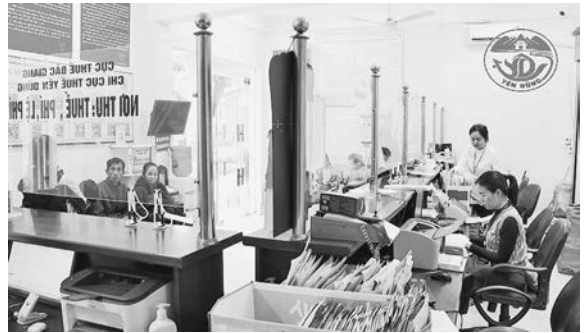
Hoạt động của bộ phận một cửa huyện Yên Dũng

Kịp thời cập nhật, tuyên truyền các văn bản