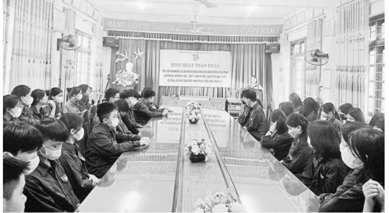
Sinh hoạt toàn Đoàn định kỳ của Đoàn xã Quỳnh Sơn

Đoàn xã Quỳnh Sơn hiện có 158 đoàn viên thanh niên tham gia sinh hoạt ở 11 chi đoàn. Để thực hiện việc học tập và làm tư tưởng, đạo đức, phong cách Hồ Chí Minh ngày càng thiết thực, hiệu quả, Đoàn TNCS Hồ Chí Minh xã Quỳnh Sơn đã đa dạng hóa các hình thức tuyên truyền, giáo dục, thu hút đông đảo đoàn viên tham gia như tổ chức thi tìm hiểu về thân thế, sự nghiệp của Bác; giao lưu văn hóa, văn nghệ; tổ chức cho đoàn viên thanh niên học tập các chuyên đề; đặc biệt là đăng ký và thực hiện các công trình, phần việc thanh niên làm theo lời Bác với 04 công trình cấp xã, 10 phần việc