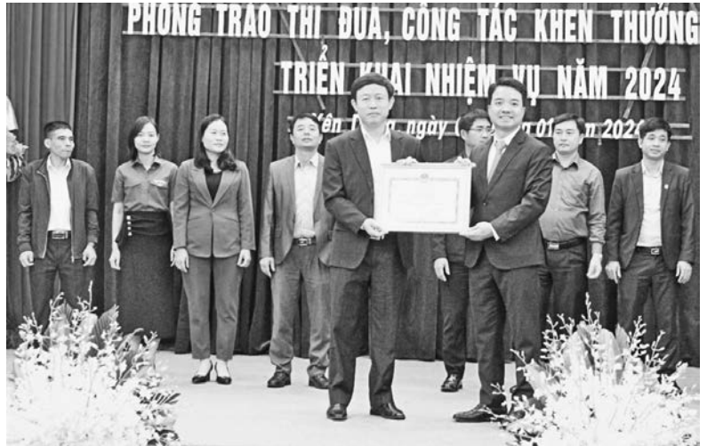
Chủ tịch UBND huyện tặng giấy khen cho các tập thể có thành tích xuất sắc trong phong trào Thi đua yêu nước huyện Yên Dũng năm 2023

Hai là: Thi đua thực hiện hiệu quả nhiệm vụ phát triển kinh tế, nâng cao năng lực cạnh tranh, phát triển nhanh, bền vững. Đẩy nhanh tiến độ thành lập, đầu tư hạ tầng các khu, cụm công nghiệp. Phát triển đa dạng các loại hình dịch vụ. Tiếp tục đẩy mạnh cơ cấu lại ngành nông nghiệp theo hướng sản xuất hàng hóa tập trung, hiệu quả, ứng dụng công nghệ cao. Tiếp tục thi đua xây dựng nông thôn mới, phát