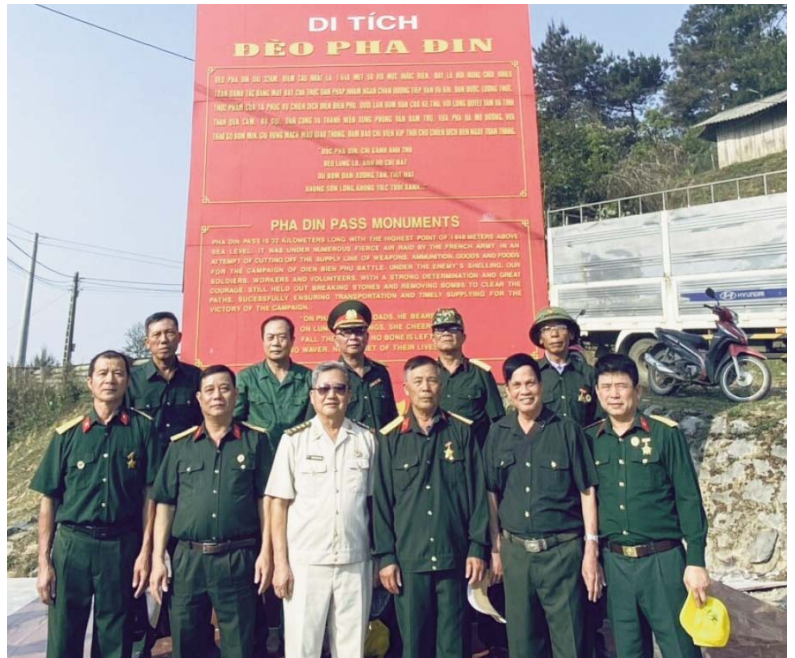
Hội Cựu Chiến binh thị trấn Nham Biền thăm các di tích lịch sử tại Điện Biên Phủ

Mục đích của chúng làm làm sai lệch bản chất sự kiện, tung ra những con số ảo và tạo nghi vấn về các số liệu lịch sử nhằm gây nhiễu loạn thông tin, xuyên tạc ý nghĩa, giá trị của chiến thắng Điện Biên Phủ - một kỳ tích của thời đại Hồ Chí Minh; hạ bệ chiến công của các chiến sĩ, Anh hùng lực lượng vũ trang Nhân dân và sự hy sinh to lớn và bao xương máu của thương binh, liệt sĩ, dân công hỏa tuyến và Nhân dân ta, từ đó làm