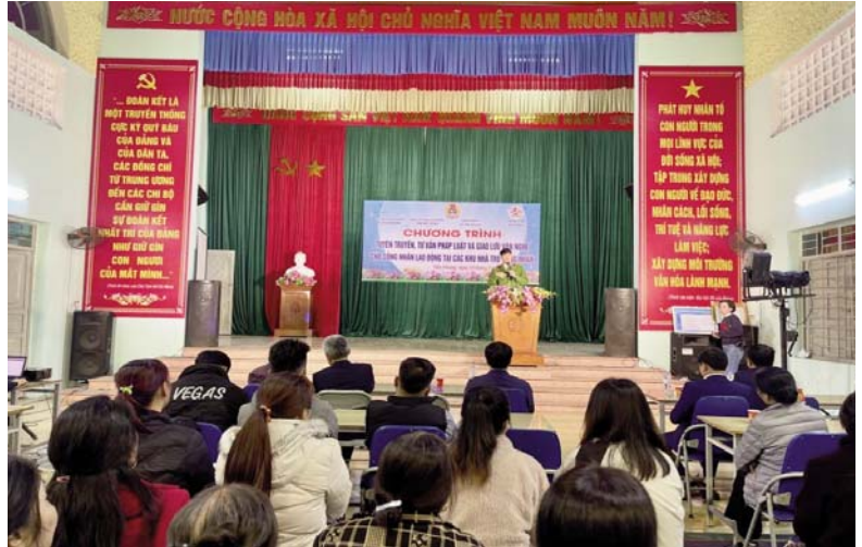
Công nhân trên địa bàn huyện thường xuyên được tuyên truyền pháp luật trong đó có pháp luật về an toàn lao động, vệ sinh lao động

Ý thức chấp hành các quy định của pháp luật về an toàn lao động, vệ sinh lao động của người sử dụng lao động và người lao động từng bước được nâng lên. Công tác huấn luyện an toàn, vệ sinh lao động của các đơn vị, doanh nghiệp được quan tâm tổ chức thực hiện. Hằng năm, các doanh nghiệp, cơ sở sản xuất kinh doanh chủ động cân đối, bố trí kinh phí để thực hiện công tác an toàn lao động, vệ sinh lao động. Công tác đào tạo, nâng cao hiểu biết, kỹ năng phòng tránh tai nạn lao động, bệnh nghề nghiệp và đảm bảo an toàn lao động, vệ sinh lao động cho người lao động đã được tăng cường triển khai; hằng năm các cơ quan, địa phương liên quan và doanh nghiệp, cơ sở sản xuất kinh doanh đã tổ