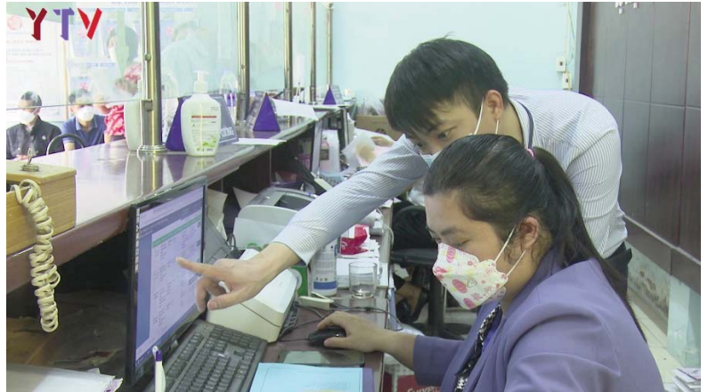
Tăng cường tiếp nhận tại Bộ phận 1 cửa huyện Yên Dũng

Theo đó, Kế hoạch nhằm triển khai thực hiện kịp thời, có hiệu quả Chỉ thị số 30-CT/TU ngày 31/01/2024 của Ban Thường vụ Tỉnh ủy về tăng cường sự lãnh đạo của cấp ủy đảng đẩy nhanh tiến độ cấp giấy chứng nhận quyền sử dụng đất, quyền sở