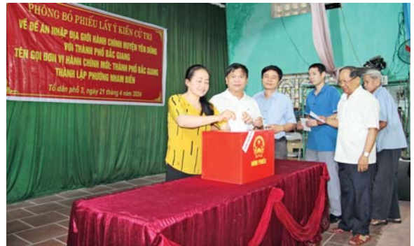
Cử tri thị trấn Nham Biền tham gia bỏ phiếu

Về thành lập phường: Số cử tri bỏ phiếu hợp lệ: 48.952, đạt 99,75 % so với số cử tri đi bỏ phiếu; Số cử tri bỏ phiếu không hợp lệ: 122, tỷ lệ 0,25% so với số cử tri đi bỏ phiếu; Số cử tri đồng ý: 48.036. Tỷ lệ so với tổng số cử tri trên địa bàn: 97,88%; Số cử tri không đồng ý: