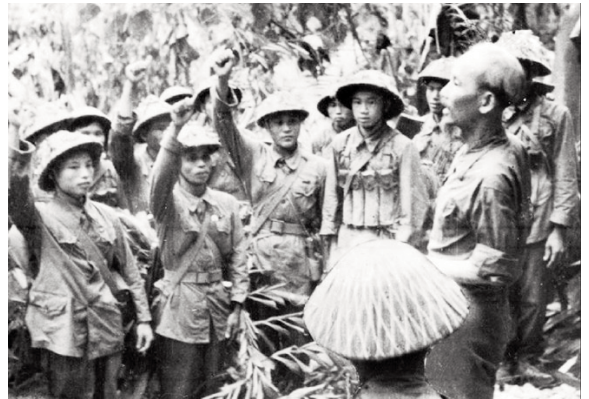
Ảnh tư liệu: Chủ tịch Hồ Chí Minh đến thăm và nói chuyện với một số đơn vị bộ đội tham gia Chiến dịch Điện Biên Phủ.

Tháng 1/1954, Bác dự cuộc họp Bộ Chính trị chỉ định cơ quan lãnh đạo, chỉ huy Chiến dịch Điện Biên Phủ. Đại tướng Võ Nguyên Giáp được