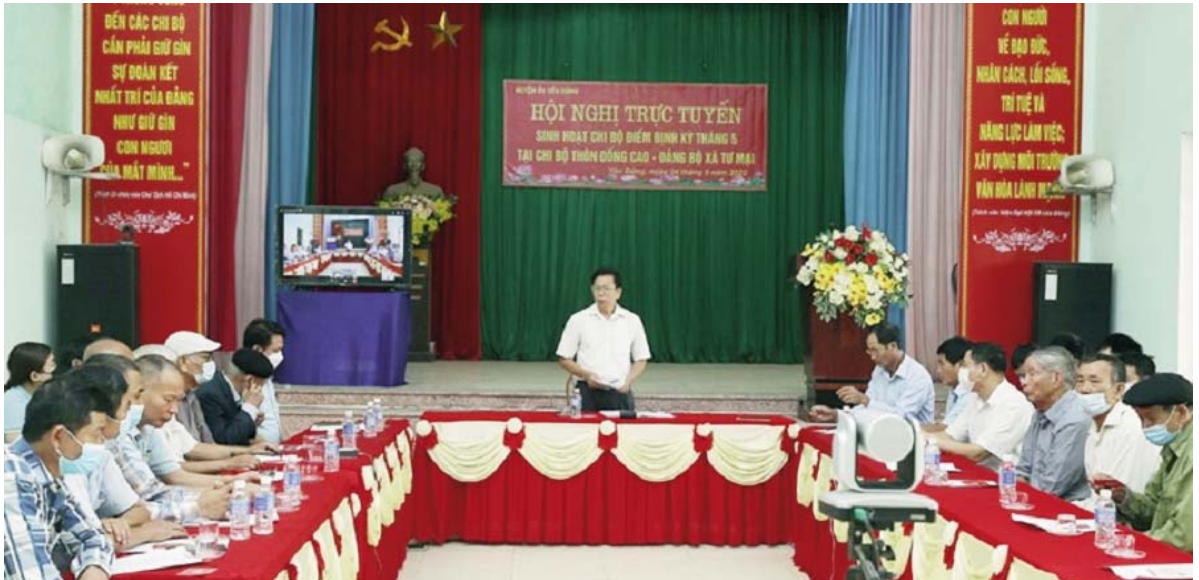
Ảnh tư liệu: Buổi sinh hoạt chi bộ điểm ở Chi bộ thôn Đồng Cao, xã Tư Mại

R à soát, sàng lọc, đưa những đảng viên không còn đủ tư cách ra khỏi Đảng là nhiệm vụ vừa cấp bách trước mắt, vừa cơ bản lâu dài; là đòi hỏi tất yếu, khách quan có tính quy luật trong công tác xây dựng Đảng. Từ thực tiễn đó, các cấp ủy, tổ chức cơ sở đảng (TCCSĐ) của huyện Yên Dũng đã tăng cường công tác rà soát, sàng lọc những đảng viên yếu kém, làm ảnh hưởng đến uy tín, danh dự của Đảng. Qua đó góp phần nâng cao năng lực lãnh đạo, sức chiến đấu của các TCCSĐ, chất lượng đội ngũ đảng viên.