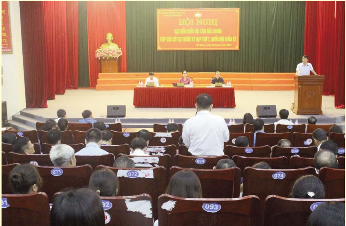
Đại biểu Quốc hội tỉnh Bắc Giang tiếp xúc cử tri trước kỳ họp thứ 7, Quốc hội khóa XV trên địa bàn huyện