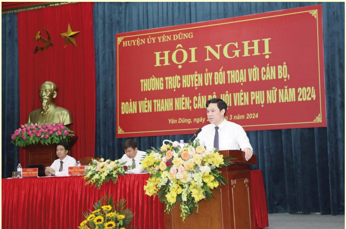
Hội nghị Thường trực Huyện ủy đối thoại với cán bộ, đoàn viên thanh niên; cán bộ hội viên phụ nữ năm 2024